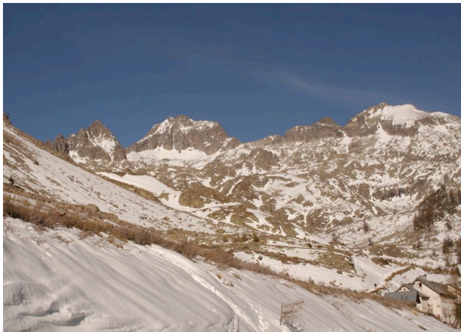
Le cirque glaciaire de la Madone de Fenestres