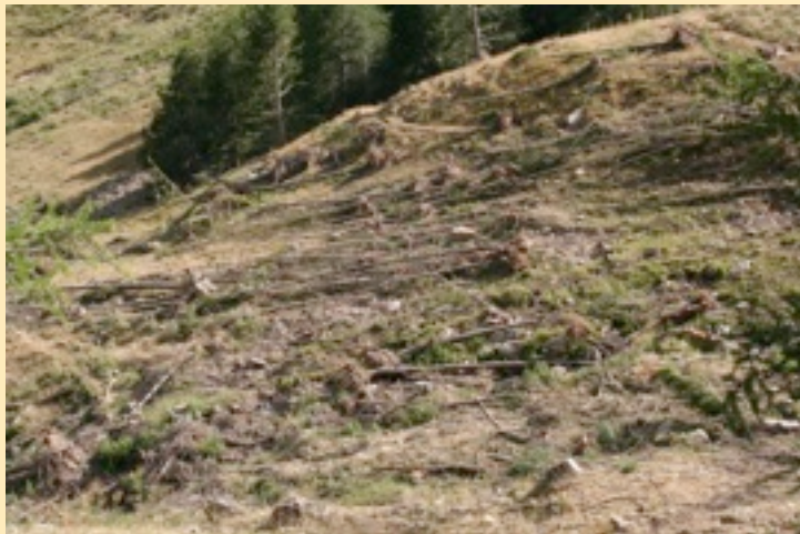
Le fond du vallon d'Anduébis, empli des arbres arrachés par l'avalanche

opération menée par le Parc et l'association Mountain Wilderness France. Une centaine de bénévoles, venant de toute la France et d'Italie, réunis du 11 au 15 juillet à Isola, ont ainsi collecté plusieurs tonnes de ferrailles et barbelés.