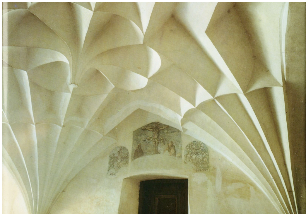
Voûte plissée, Bohême