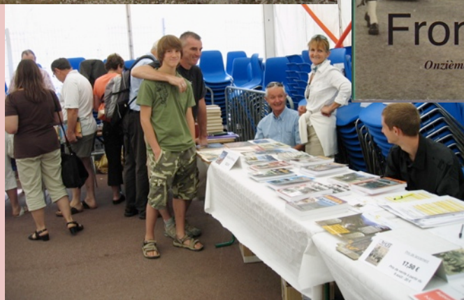
Le stand de l'AMONT à "Livres en fête", 8 août, Saint-Martin Vesubie

Belle découverte, donc, mais qui pose de multiples problèmes nouveaux, comme la nécessaire alimentation en eau de la structure, la présence hypothétique mais probable d'une forge à proximité, un volume de minerai traité qui dépasse le petit artisanat, sans compter les questions de datation, toujours cruciales. Beaucoup de travail donc pour Gaspard cet hiver, et rendez-vous déjà pris pour la campagne 2011.